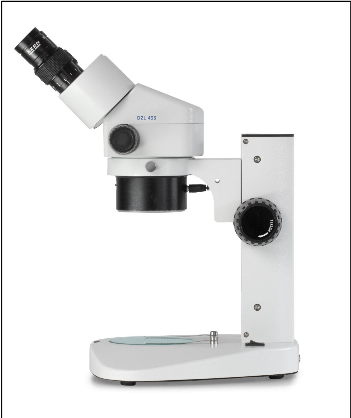
Microscope stéréo à zoom entièrement monté