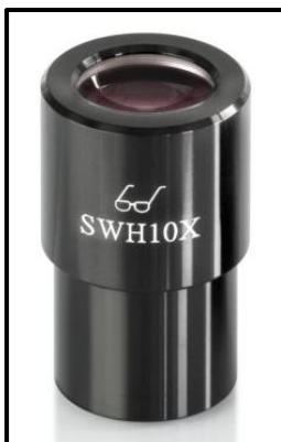
Oculaire high eye point (reconnaisable au symbole des lunettes)