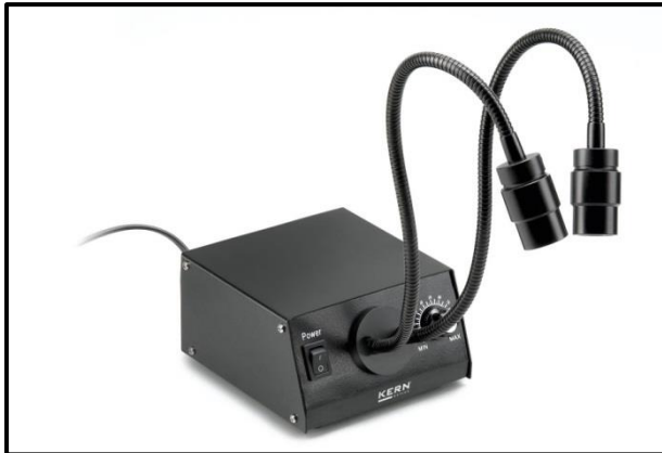
Éclairage col-de-cygne typique

Les unités d'éclairage adaptées aux appareils de la série OZL-45R sont des éclairages cols-de-cygne ( voir la figure ). Ils peuvent être à LED ou à halogène et disposent d'un interrupteur et de différents réglages.