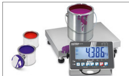
Création de formules