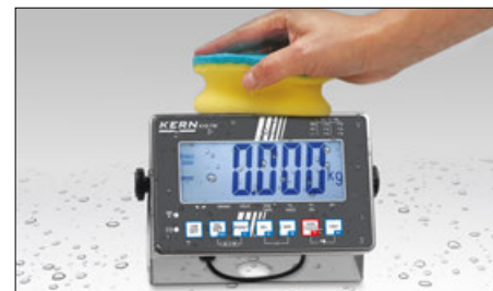
Construction en inox de l'afficheur et du plate-forme, facile à nettoyer grâce à ses surfaces lisses