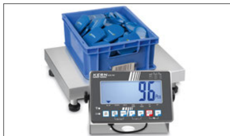
Comptage de pièces

Balance plate-forme en acier inoxydable de haute qualité avec afficheur IP68 en acier inoxydable – maintenant disponible en modèle haute résolution