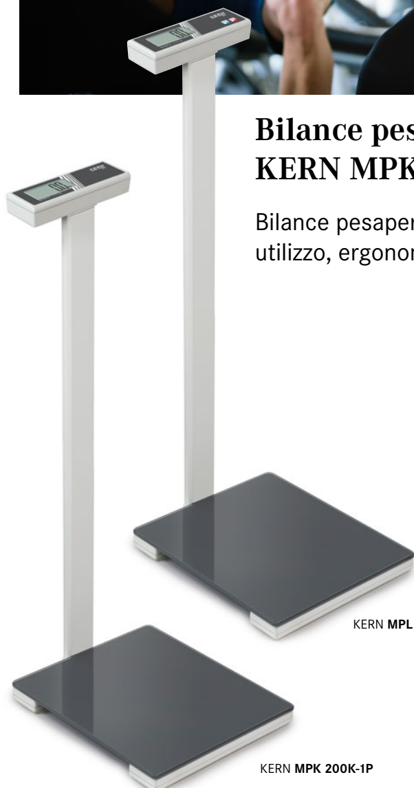
KERN MPL 200K-1P

Bilance pesapersona con stativo per un comodo utilizzo, ergonomicamente ottimizzato