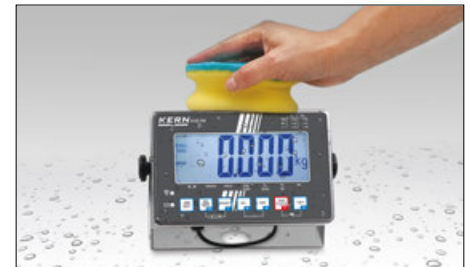
Afficheur en inox avec degré de protection IP68, hygiénique et facile à nettoyer