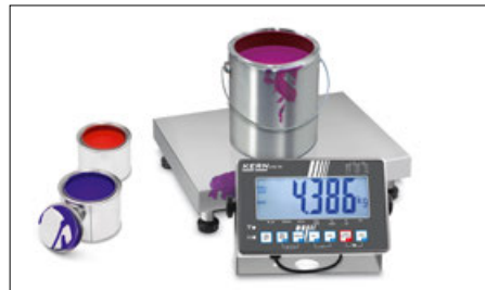
Plateau de pesée résistant en inox