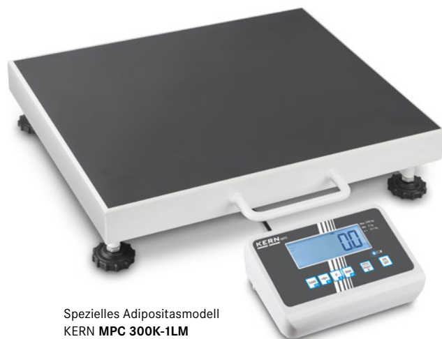
Spezielles Adipositasmodell KERN MPC 300K-1LM