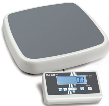
KERN MPC 250K100M

Professionelle Personenwaage mit Eich- und Medizinzulassung für den professionellen Einsatz in der medizinischen Diagnostik