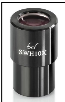
Oculaire à point d'observation élevé (reconnaisable au symbole des lunettes)