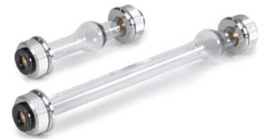
Cuvette 10 et 20 cm