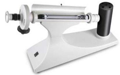
Cuvette dans la chambre de mesure