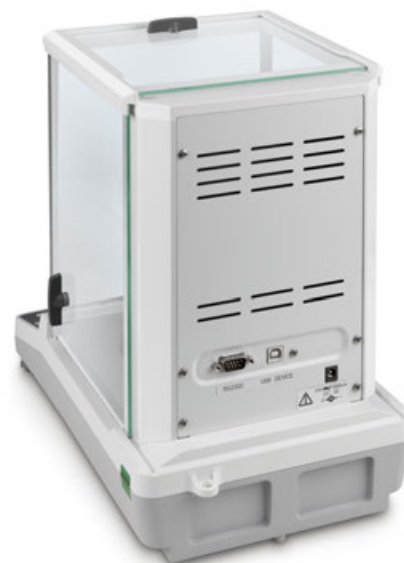
KERN ACS/ACJ mit serienmäßiger Datenschnittstelle RS-232 und USB

Der Bestseller unter den Analysenwaagen, mit hochwertigem Single-Cell Wiegesystem, auch mit Eichzulassung [M]