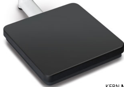
KERN MPB-P con soporte