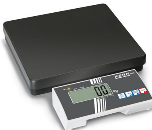
KERN MPB con indicador