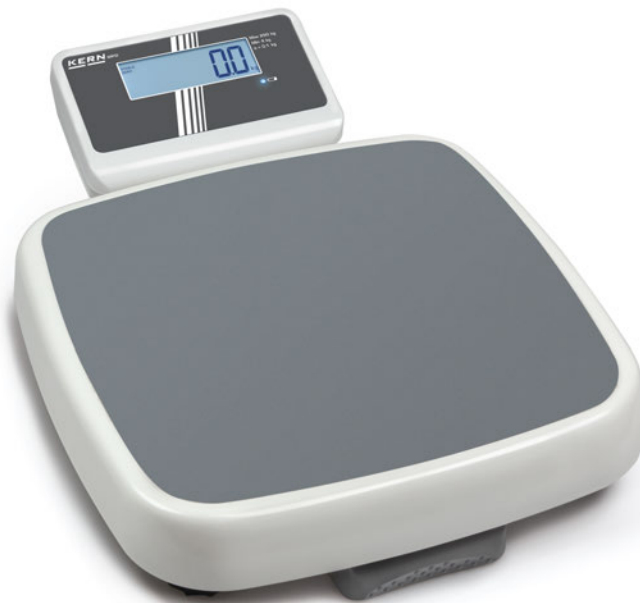
KERN MPD 250K100M

Professionelle Step-On-Personenwaagen mit Eich- und Medizinzulassung