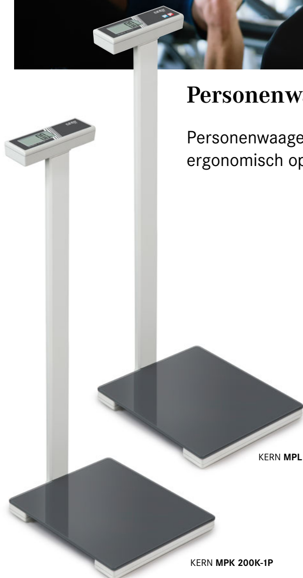
KERN MPL 200K-1P

Personenwaagen mit Stativ für eine bequeme, ergonomisch optimierte Bedienung