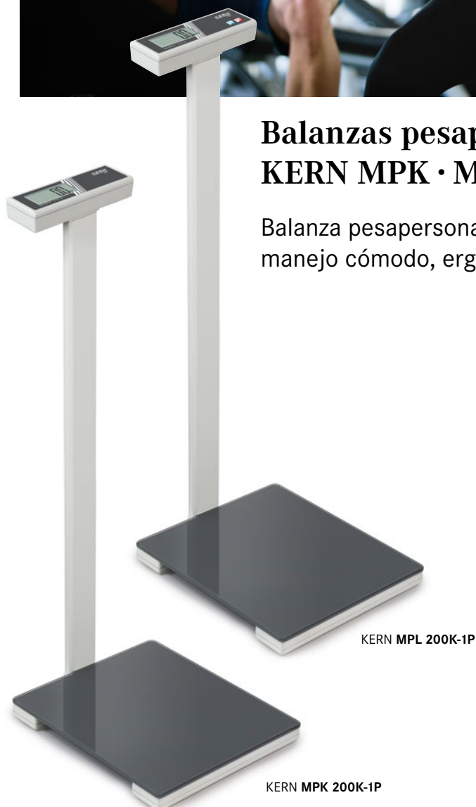
KERN MPL 200K-1P

Balanza pesapersonas con trípode para un manejo cómodo, ergonómico y optimizado