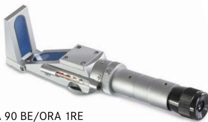
ORA 90 BE/ORA 1RE