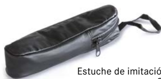
Estuche de imitación de cuero ORA-A2103