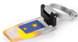
Tapa Prisma ORA-A1101