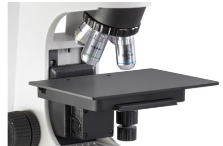
Tavolino portaoggetti e obiettivi