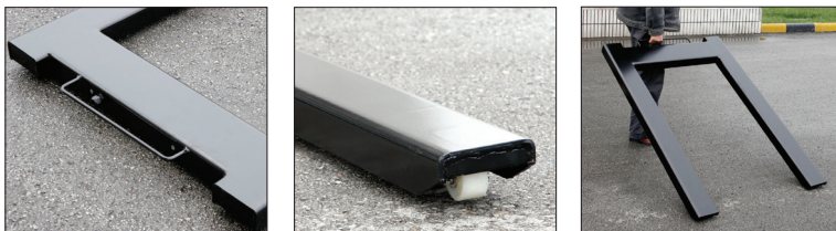
Haltegriff und vorne montierte Rollen zum praktischen Anheben und Transportieren der Waage