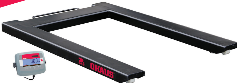
Modell aus lackiertem Stahl mit T31P Anzeigegerät abgebildet