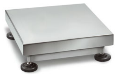
8 KERN KFP-V30