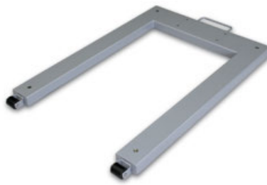
7 KERN KFU-V20/V30