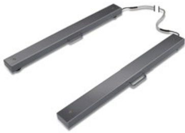
6 KERN KFA-V20