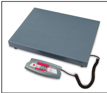
Disponibili modelli da 75 kg e 200 kg con piattaforma grande