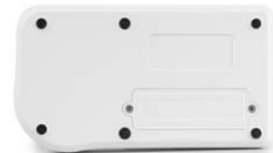
Vue face arrière, couvercle vissé du compartiment des piles