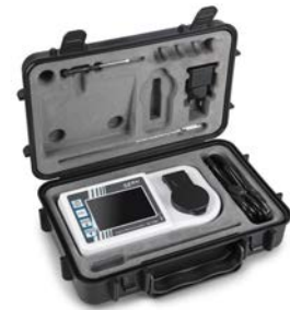
Mallette de rangement